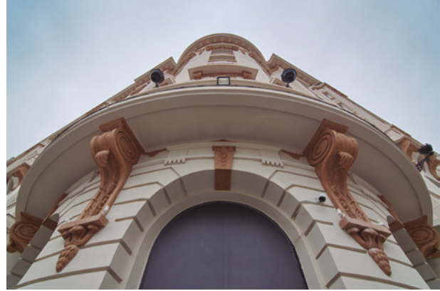
1. Vista exterior ^

El valor añadido de este proyecto reside precisamente en su capacidad para establecer un diálogo entre pasado y presente, entre memoria y uso, entre arquitectura e ingeniería. En este sentido, Ruiz Larrea Arquitectura ha abordado el encargo desde una visión disciplinar de la arquitectura como herramienta de conocimiento y transformación, no solo como construcción. La intervención en The Palace Madrid no es un "lifting" patrimonial, sino una operación compleja que pone en valor el potencial del proyecto arquitectónico como instrumento de gestión cultural. Cada decisión ha sido el resul-