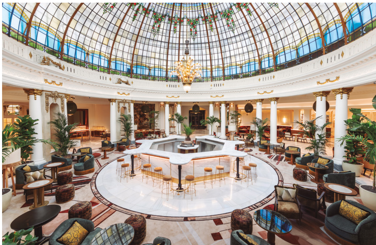
^ Foto: The Palace a Luxury Coleccion Hotel, Madrid - La Cúpula