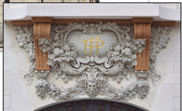
Detalle Entrada