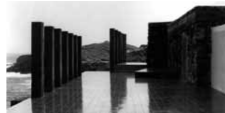
Casa Vittoria en Pantelleria

Es muy difícil hacer recomendaciones a estudiantes 50 años más jóvenes que yo. Cuando me lo han preguntado