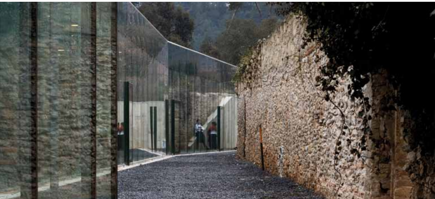
Centro Internacional de Alimentación y Ciencia en Sant Benet del Bages, Barcelona (2006-2007).

La cultura, aquello que como decía Goethe nos permite prescindir de muchas cosas sin llegar a la miseria, es una visión sabia y por tanto práctica.