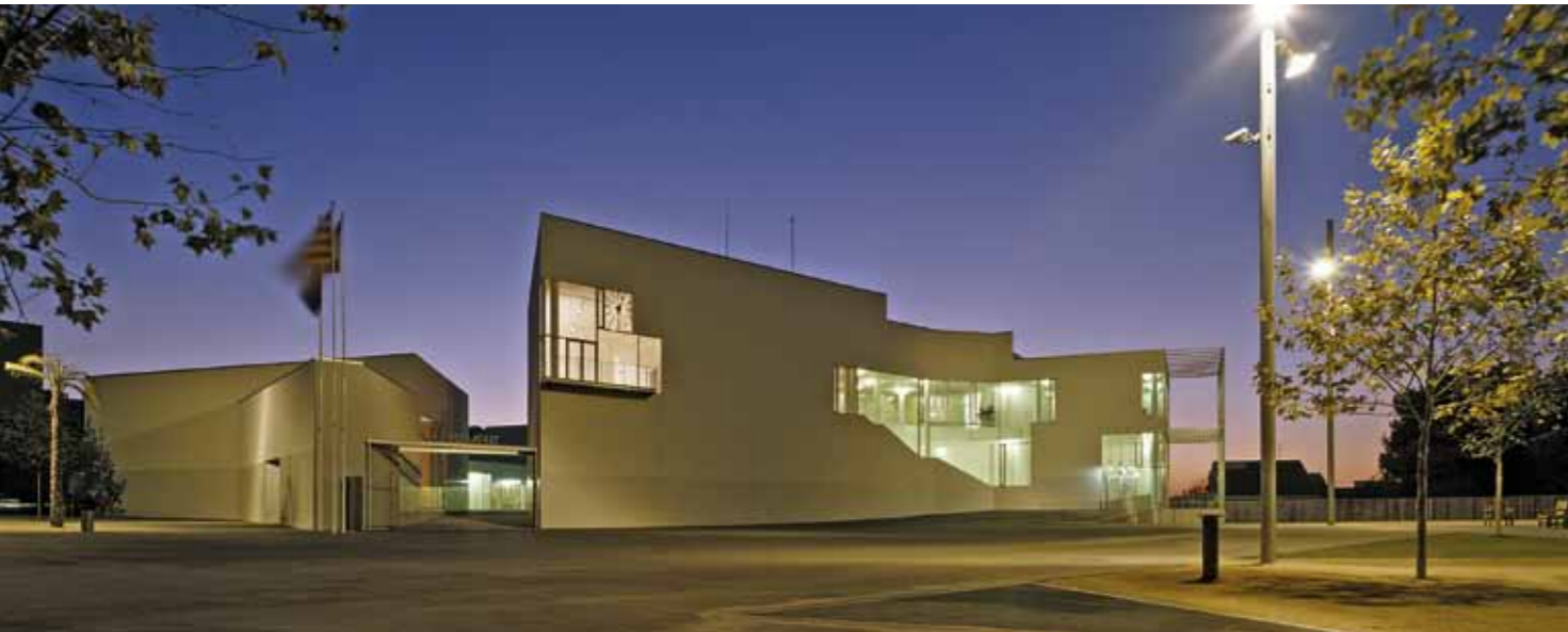
Ordenación y Dependencias Municipales, St. Pere de Ribes, Barcelona (2001-2004).

eran unos trasteros desorganizados dando a la plaza. No habíamos conseguido que aquellos espacios sugirieran nada lúdico a los usuarios. Toda aquella cultura centenaria de los abuelos había desaparecido en dos generaciones y solo nos quedaba nuestra nostalgia.