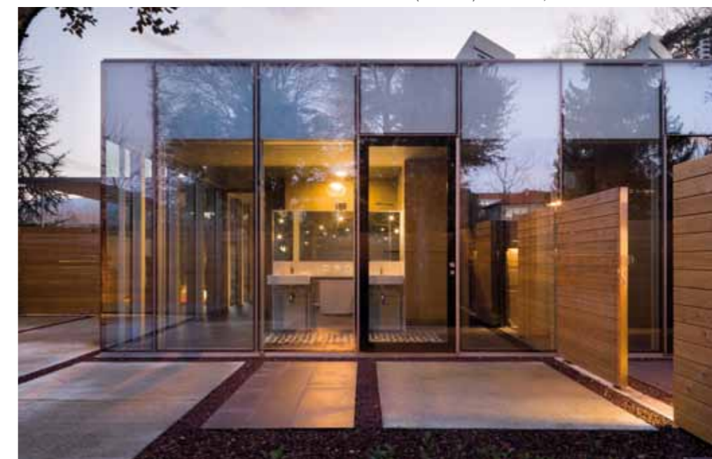
Casa unifamiliar en Olot (2006-2008).

El otro día fui a curiosear y vi que solo una de las veintitantas terrazas se usaba como tal, llena de plantas, y con una mesa generosa iluminada por una lámpara colgada del sombrero que sugerían comidas y cenas familiares. Las demás