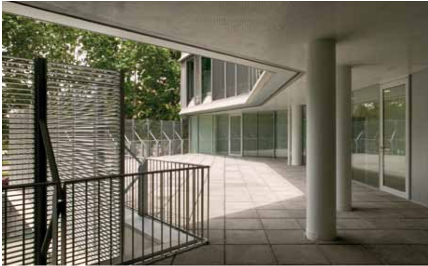
Centro de servicios sociosanitarios del IMAS (Geriatrico) Barcelona (2002-2005).

Todos sabemos que hay premios acertados, premios incompresibles, premios injustos, premios amañados... A la larga todo esto no tiene importancia porque será el tiempo, juez coral y lento, que comete pocos errores, el que vaya colocando las cosas en su sitio. Y este juicio será severo y muy pocos engrosarán la lista de los grandes.