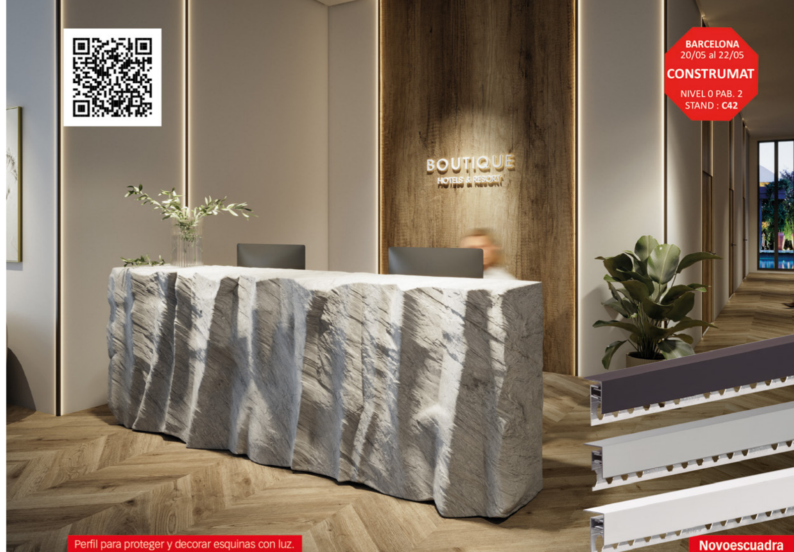
Perfil para proteger y decorar esquinas con luz.

BARCELONA 20/05 al 22/05 CONSTRUMAT NIVEL 0 PAB. 2 STAND : C42