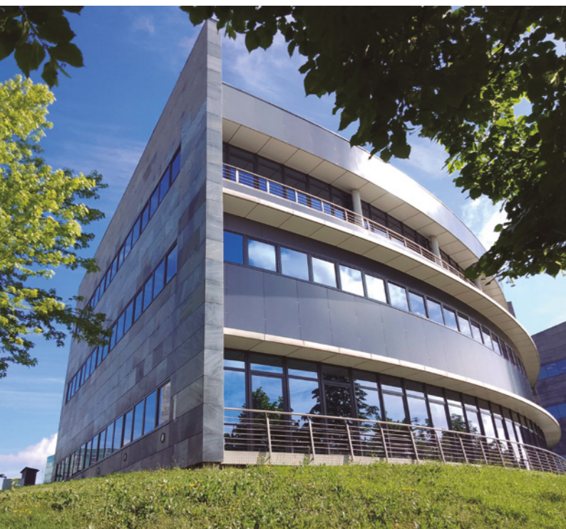
Instalación de las ventanas y balconeras de la serie exclusiva KIOM en el campus de Vitoria-Gasteiz del Parque Tecnológico de Euskadi. Foto: Hermet 10

miento: ya no es solo un filtro, sino una interfaz activa entre el edificio y el clima. Estos avances permiten a los edificios ser más autosuficientes y adaptativos”, menciona el Product Manager de TECHNAL y WICONA. Asimismo, la arquitecta del Departamento Técnico de Geohidrol añade que los avances tecnológicos que destacan en los cerramientos incluyen el vidrio inteligente, que ajusta su opacidad o transparencia para controlar luz y calor; recubrimientos fotovoltaicos, que generan energía solar; cristales con control solar para bloquear rayos UV; sistemas automatizados integrados con domótica, y materiales avanzados que mejoran el aislamiento térmico y acústico. “Estas innovaciones maximizan la eficiencia energética, la sostenibilidad y el confort”.