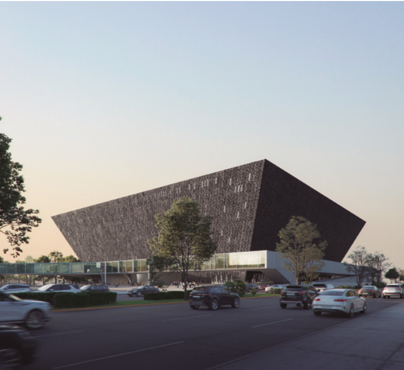
Arena Multisport en León de los Aldama

Tampoco considero que la arquitectura esté incorporando de forma decidida materiales y tecnologías verdaderamente novedosas, como el kevlar, las cerámicas ultra finas y de alta resistencia empleadas en la industria armamentística, o los biometales utilizados en procesos quirúrgicos. Más bien, parece conformarse con materiales que responden a la presión normativa y el greenwashing institucional, con soluciones tradicionales como, la madera, el barro o incluso la lana de oveja local.