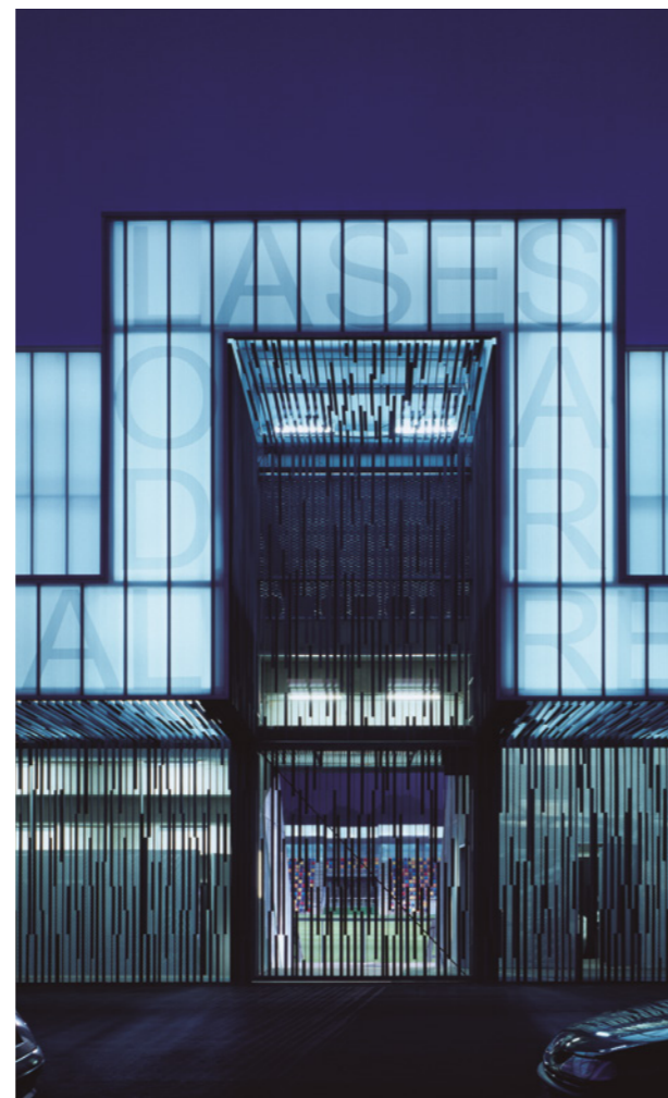
✓ Foto: Estadio Lasarre en Barakaldo

Has trabajado desde mobiliario urbano hasta urbanismo y campus universitarios. ¿Qué te atrae de esta diversidad de escalas y cómo se enriquecen unas a otras en tu enfoque creativo?