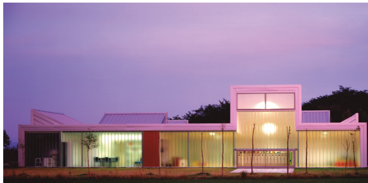
^ Foto: Guardería en Sondika

otras ciudades como Viena, Oslo o Bilbao han supuesto importantes saltos cualitativos en nuestra genética propositiva. Nunca he reflexionado sobre esto pero puede que tenga mucho que ver con la calidad de las personas que me he encontrado en cada una.