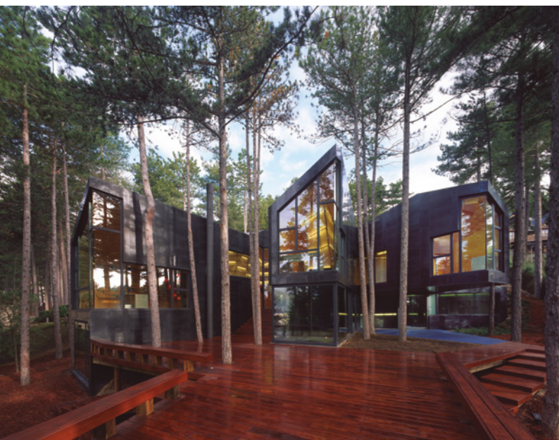
✓ Foto: Casa Levene en El Escorial

Los grandes aprendizajes como arquitecto me han ocurrido en situaciones adversas relacionadas con el comportamiento de personas: clientes, otros arquitectos, empresas o instituciones. Esas experiencias las tengo siempre muy presentes al inicio de cualquier proyecto como un escáner muy efectivo de las situaciones en las que me sitúo y son una alerta poderosa.