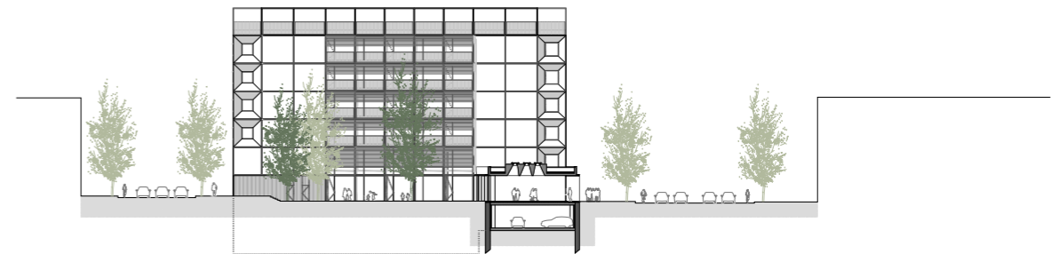
∨ OAB_Oficinas HIIT Barcelona_Plano Alzao Pere IV