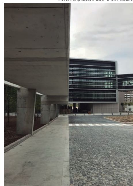
Foto: Ampliación EUIPO en Alicante

La nueva arquitectura surgida del Movimiento Moderno, racionalista y funcionalista cayó en un cierto descrédito social al convertirse el funcionalismo en un término peyorativo asociado a las arquitecturas más banales, baratas y convencionales, ajenas a cualquier consideración plástica o estética. Este desprestigio, que ha llegado hasta