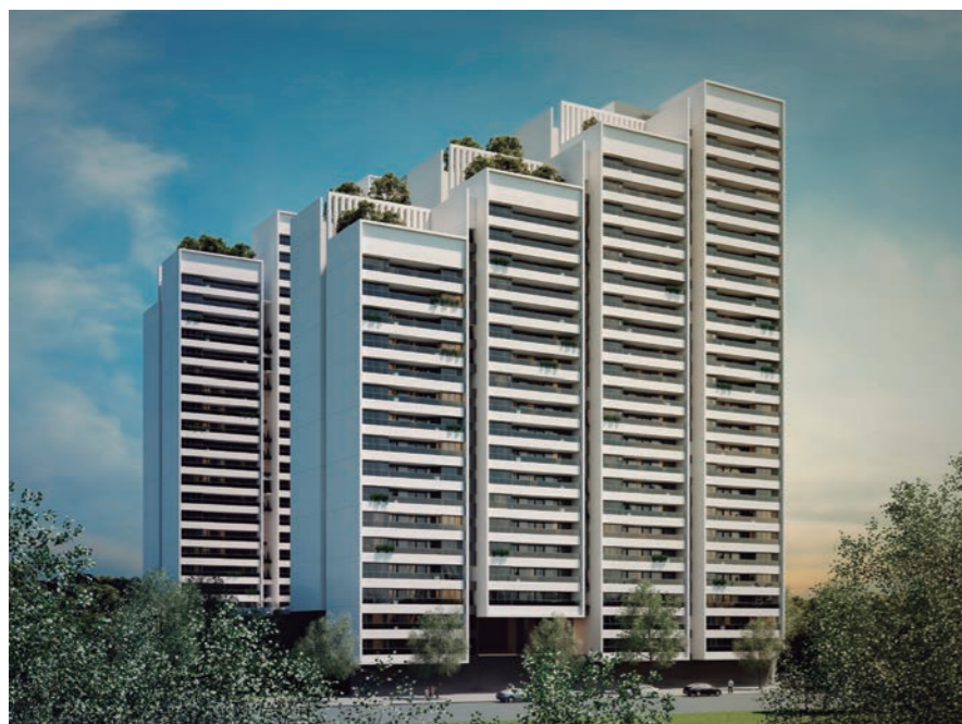
Foto: Proyecto Residencial en Addis Abeba