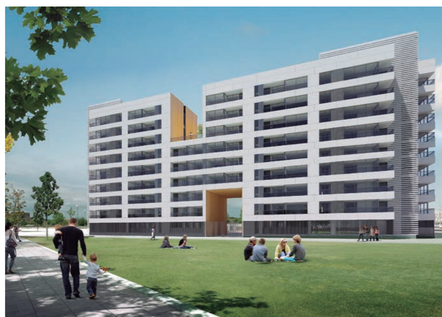
Foto: Proyecto Residencial Isla de Mouro en Vallecas

personal. Es inevitable utilizar recursos ya aprendidos o recorrer caminos ya explorados, porque siempre son susceptibles de mejora.