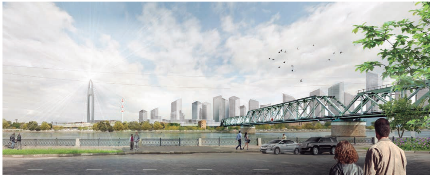
Foto: Primer Premio Concurso Internacional Ordenación ZIL TERRITORY en Moscú