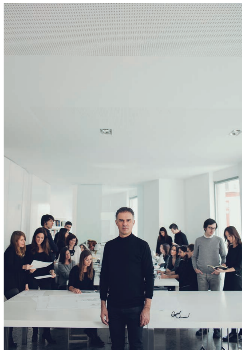
Ramón Esteve Estudio