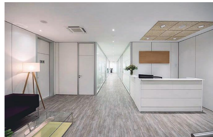
Foto: Centro Principal de Control de Enagás Luminaria

Nuestro valor añadido ha sido, desde siempre, acompañar a nuestros clientes en cada una de las fases del proyecto con el objetivo de lograr la más alta calidad. Además, este principio está en nuestro ADN. Como te comentaba, para nosotros es clave lograr la excelencia