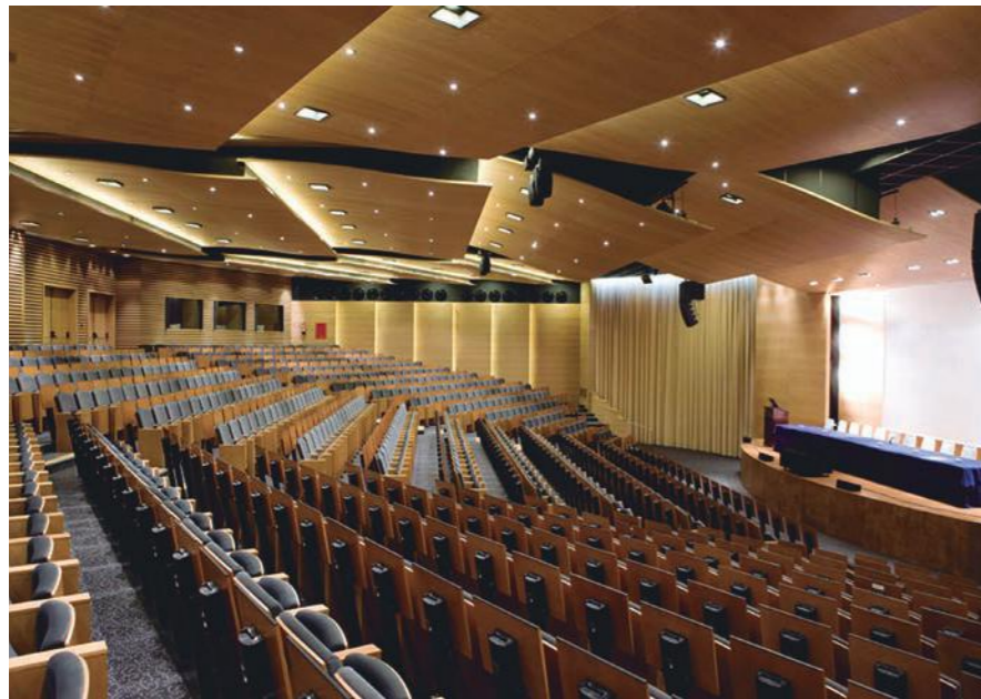
Foto: Auditorio Hotel Beatriz

estética, expresión artística, excelencia constructiva, conservación del medio ambiente...)