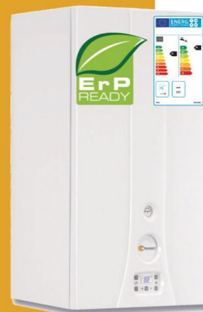
Myto Condens Plus