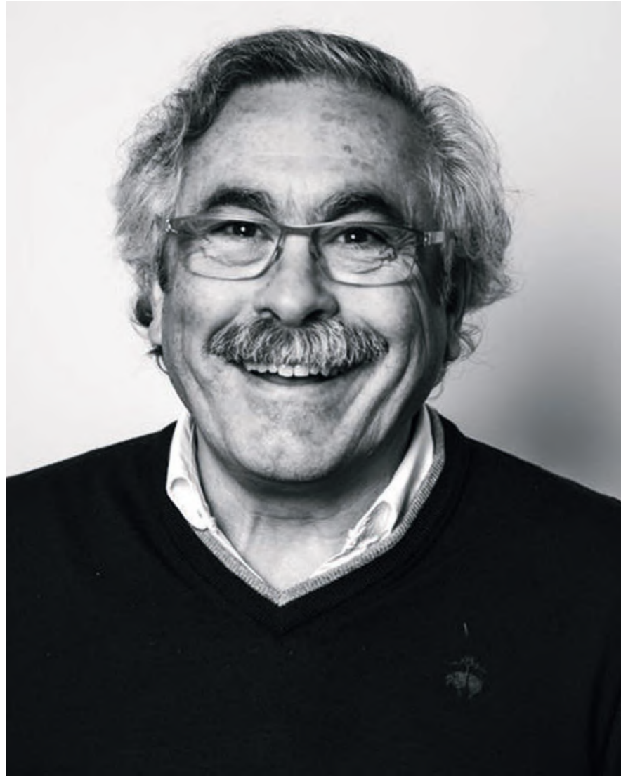
Foto: Juan Luis Requena, Socio Fundador de Requena y Plaza Arquitectos

“El punto de partida de este proyecto era un inmueble que había perdido su personalidad por diversas reformas poco coherentes entre ellas, pero era un edificio con mucho potencial...”