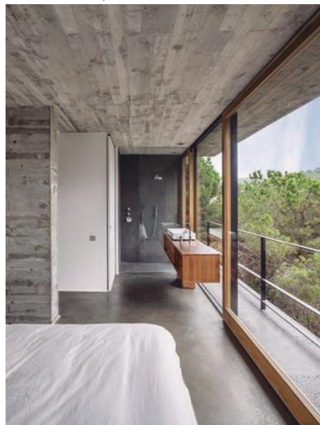
Foto: Vivienda unifamiliar Mediterrani 32 en Sant Pol de Mar, Barcelona. Adrià Goula

El final de la crisis ha implicado una mayor deslocalización, impulsada por la especialización. Cada vez más el promotor de una tipología específica de proyecto confía más en la capacidad técnica de un estudio para resolverlo que en la distancia, y esto implica que estructuras medianas como