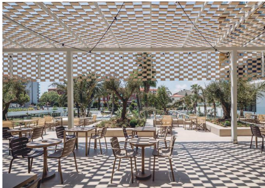
Fotos: Hotel Silhouett en Malgrat de Mar, Barcelona.

que debe ser entendible a lo largo de todo el edificio, y por último debe tener algo más, un intangible que lo diferencie de lo que lo rodea.