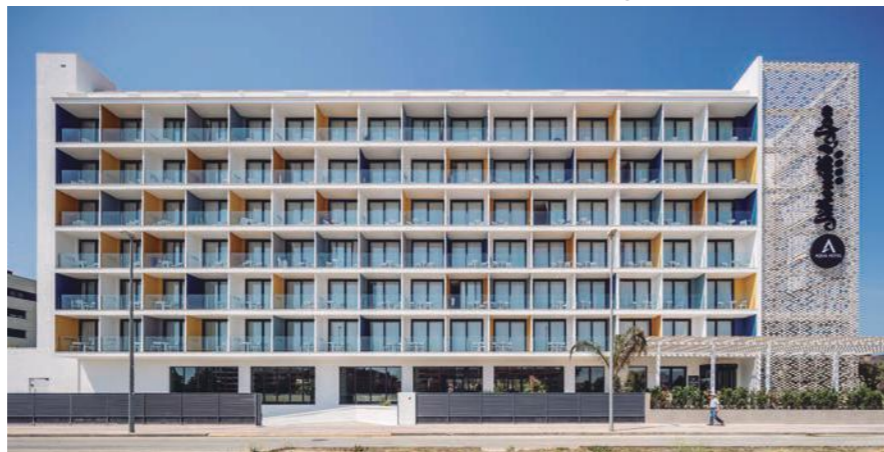
Foto: Hotel Silhouett en Malagràt de Mar, Barcelona.

Por un lado no creemos que seamos el referente en nada, pero lo que tal vez mejor nos defina sea el esfuerzo y dedicación diarias para dar siempre lo mejor de nosotros en cada proyecto, entendiendo que la especialización es la clave para desarrollar proyectos vinculados a una actividad económica, en nuestro caso la hotelera.