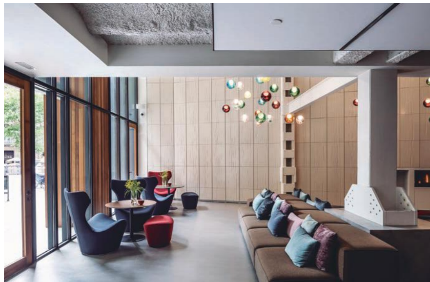
Foto: Hotel Ohla Eixample, Barcelona.

Pero sin querer desmerecer a ninguno de ellos quiero destacar otro tipo de proyectos más discretos, con un presupuesto mucho menor, pero un impacto infinitamente más grande en su entorno, como el Silhouette en Malgrat de Mar, donde la transformación de una estructura obsoleta con un presupuesto muy controlado consigue dinamizar y revolucionar no solo lo que pasa en el hotel, sino también lo que pasa en su entorno.