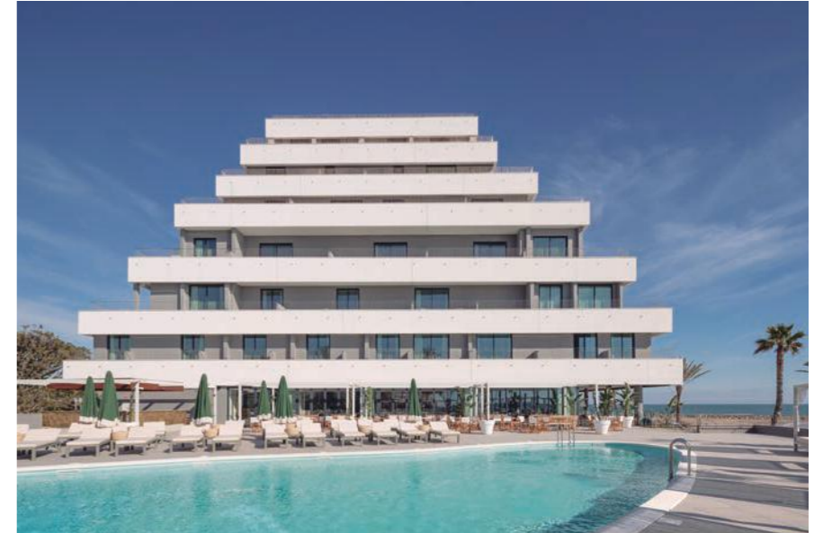
Hotel Me en Sitges Terramar, Barcelona.

Creemos en la vocación de servicio, en intentar dar siempre ese poco de más que permite al proyecto llegar algo más allá. Entendemos cada proyecto como un único, en el que la arquitectura debe intentar crear un diálogo con su usuario que vaya algo más allá de la inmediatez que pueda proporcionar un mero acabado o revestimiento. La proporción, la relación del usuario con el espacio que lo rodea, la integración con el entorno, deben ser las piezas claves a la hora de abordar un proyecto.