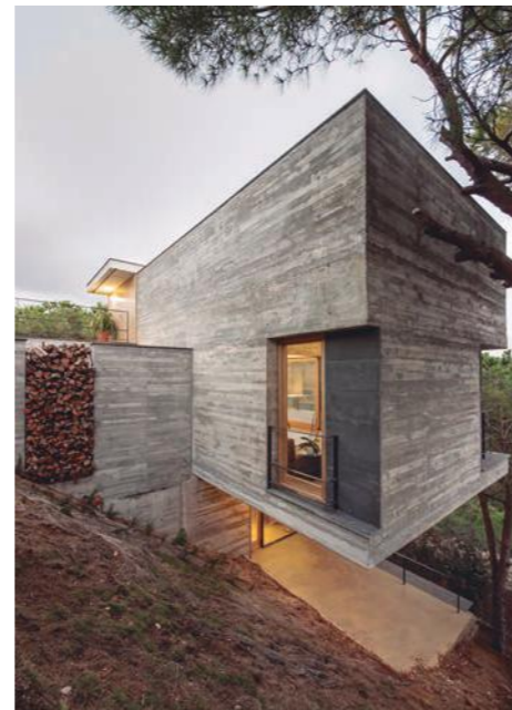
Vivienda unifamiliar Mediterrani 32 en Sant Pol de Mar, Barcelona.

Es evidente que su formación es distinta a la nuestra, con lo que siempre se podrá comparar una con la otra, pero también estos tiempos son algo distintos a los que yo encontré como recién titulado.