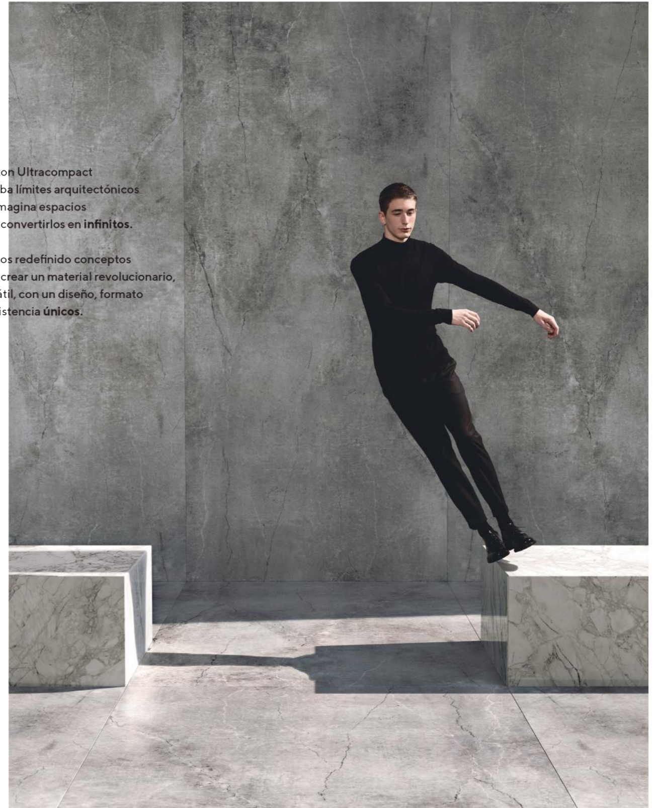
A product designed by COSENTINO

Hemos redefinido conceptos para crear un material revolucionario, versátil, con un diseño, formato y resistencia únicos.