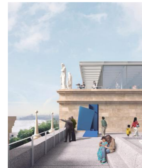
Foto: Paseo de Pereda 9-12: Imagen de la terraza con vistas a la bahía

Asimismo, la tecnología se convierte también en protagonista dentro de un proyecto con