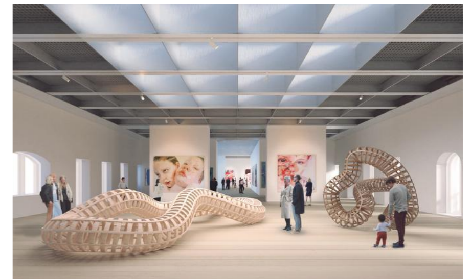
Foto: Paseo de Pereda 9-12: Imagen de la galería de la cuarta planta dedicada a exposiciones temporales

Así pues, el edificio Paseo Pereda se integrará, dentro de la ciudad con espacios culturales y abiertos, que realzan el legado del Banco en la ciudad de Santander y Cantabria, sirviendo