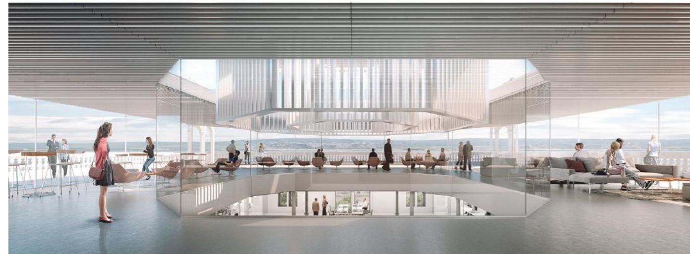
Foto: Calle Hernán Cortés 11: Vista planta ático. Espacio mirador

Para poder disfrutar de estos proyectos todavía habrá que esperar un poco. Según las previsiones que se dieron en su presentación, los trámites urbanísticos durarán un año. Mientras, su ejecución, en el caso del edificio de la Calle Hernán Cortés, el plazo estimado será de 20 meses, y de 36 será para el del Paseo de Pereda.