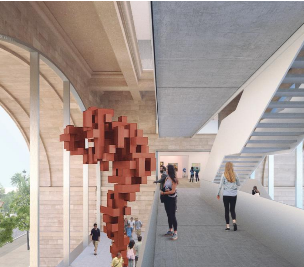
Foto: Paseo de Pereda 9-12: Imagen del interior del arco que muestra la conexión entre galerías y la nueva ventana a la ciudad

de foco para atraer turistas. De este modo, se pondrán en marcha actividades formativas y culturales para todos los públicos y que los visitantes puedan disfrutar de las obras en distintos entornos.