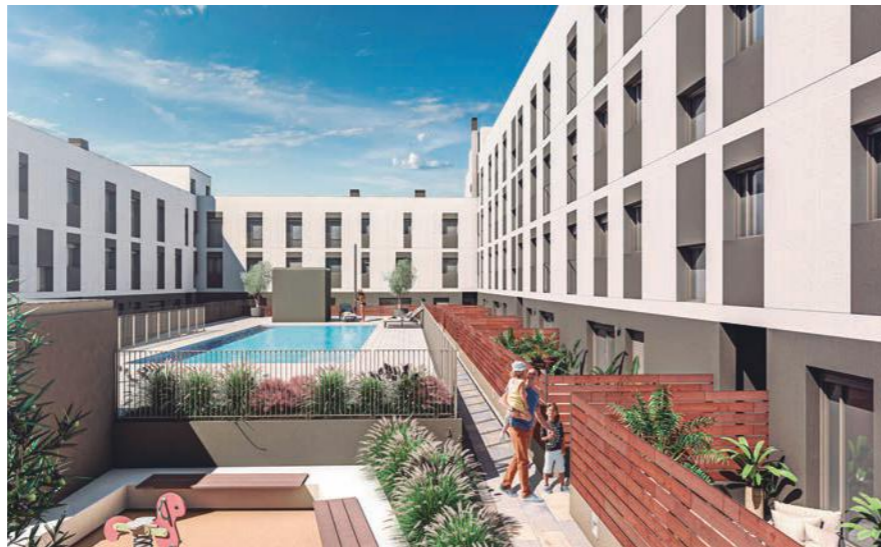
Foto: Residencial INBISA Arxidux