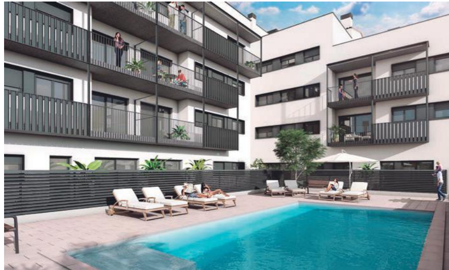
Foto: Residencial INBISA Ripollet Centre