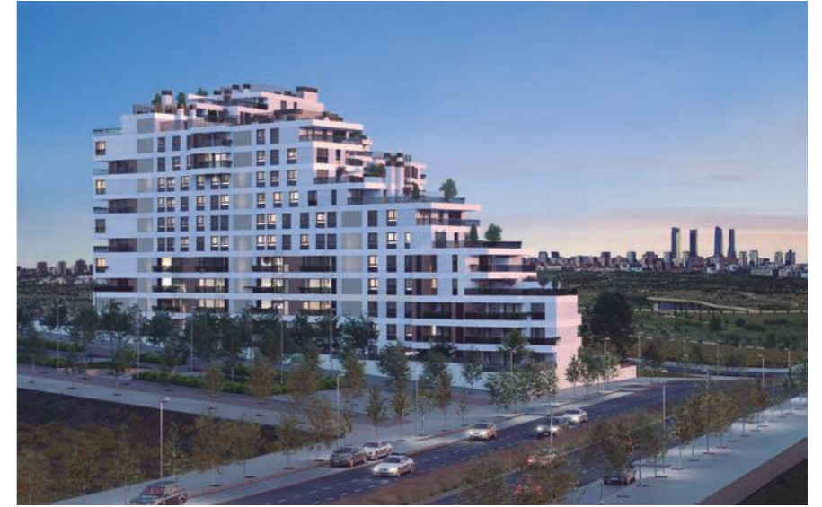
Foto: Residencial INBISA Valdebebas 169

No obstante, desde INBISA Inmobiliaria, "con independencia de la situación que atraviesa el mercado, continuamos aplicando el rigor en cada decisión que tomamos y somos muy analíticos, desde el proceso de selección de suelo hasta la definición del producto". Además, como empresa que sobresale en el sector inmobiliario, INBISA Inmobiliaria cuenta con unas señas de identidad particulares que