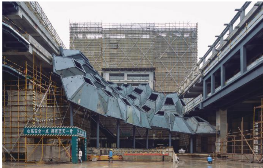
Foto: Campus de la Universidad de Fudan – Escuela de Negocios. Shanghái, China. En construcción

Porotrolado, cada vez es más común observar a un arquitecto español construyendo o abriendo su propio estudio en otro país, ¿cómo está viviendo la arquitectura este momento de globalización? ¿Aporta mayor internacionalización para la arquitectura española?