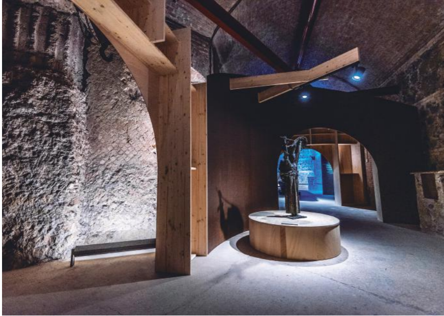
Foto: Exposición 'Lessico Italiano' en el Monumento al Vittoriano. Roma, Italia. 2019

En el hospital se sana con medicinas, pero quizás falta una parte emotiva, de cariño, estar como en casa, y estos pequeños edificios proporcionan justamente esto. Es sorprendente cómo un edificio de máximo 500 m², al lado de estas gigantes construcciones, puedan ofrecer un complemento importantísimo a lo que es la medicina que puedan dar en el hospital.