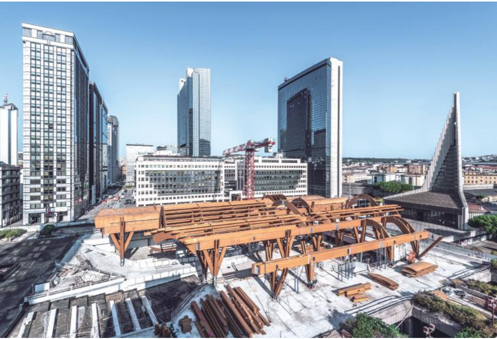
Foto: Estación Central de Nápoles. Nápoles, Italia. En construcción

Primero que nada, defínanos ¿qué es para usted la arquitectura?