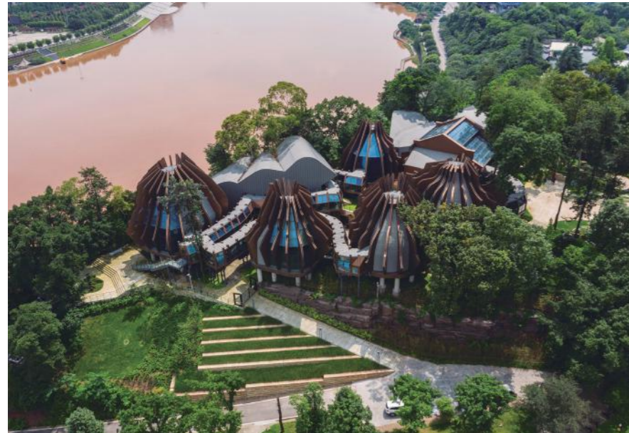
Foto: Museo Zhang Daqian. Neijiang, China. 2019 - Foto: Shen Zhonghai

La arquitectura tiene implicaciones muy fuertes y, a veces, no nos damos ni cuenta porque lo damos por supuesto, pero puede interactuar muchísimo, tanto para lo bueno como para lo malo. Y nosotros los arquitectos intentamos que sea siempre para lo bueno.