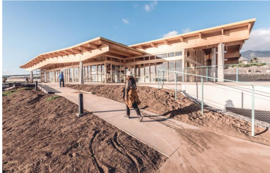
Foto: Templo Budista en Adeje. Tenerife, España. 2019

Ha habido una especie de guerra hacia los arquitectos estrella. Considero que éstos han sido producto del proceso de globalización que ha habido tan increíble. Cuando, por ejemplo, un arquitecto de Francia quiere construir en España debe hacerse conocer, por ello o sale en los medios de comunicación o nadie lo acepta. Por lo tanto, esa manera de intercambiar arquitectos ha sido lo que ha generado estas grandes figuras, que se