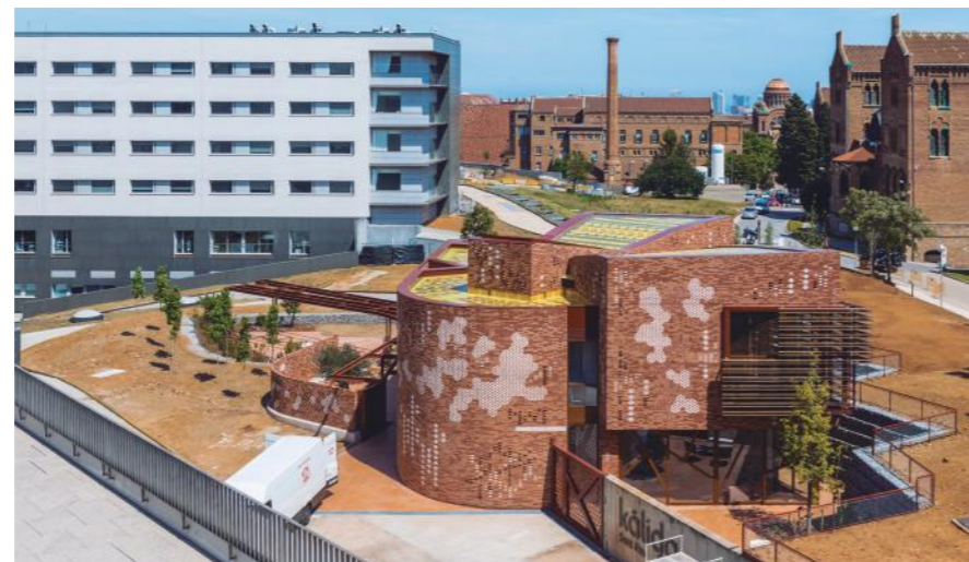
Foto: Centro Kálda Sant Pau. Barcelona, España. 2019

No, difícil es difícil para todos. Sobre todo la frontera que se ha desdibujado más y más es la de la profesión. Por ejemplo, Rafael Moneo, para mí, ha sido siempre un mito, que ha marcado la manera de ser de un arquitecto en España hasta hace muy poco. Un arquitecto que se dedica, con una gran calidad, al estudio y a la academia, a la universidad, a enseñar cómo crecer... Pero ahora