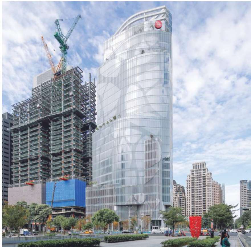
Foto: Torre Chinatrust. Taichung, Taiwán. 2019

Me encuentro muy bien en China. Cuando fui, tenía 18 años, y era la primera vez que visitaba la China Comunista, y al entrar y ver las montañas lo primero que pensé es que eran exactamente como las pinturas, observé la relación que hay entre la realidad de un paisaje y la realidad del arte, y entonces me enamoré. Y pensé, tengo que volver aquí, y lo he conseguido.