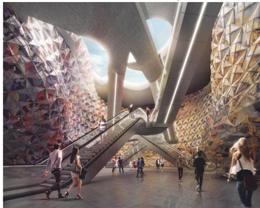
Foto: Estación de metro Clichy-Montfermeil. París, Francia. En curso

Tengo una teoría personal, considero que las mujeres en la sociedad somos las que mejor sabemos adaptarnos, porque, a lo largo de los años y como ha sido tradición en casi todas las sociedades, hemos sido nosotras