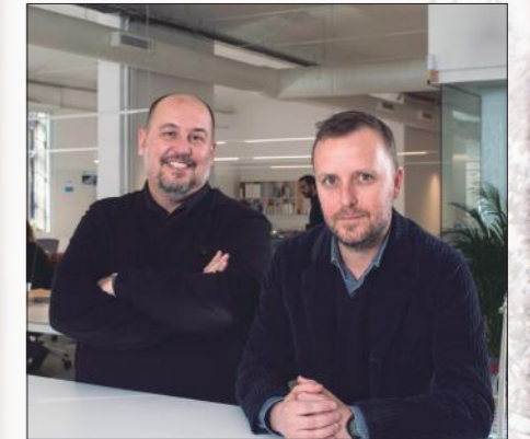
Patricio Martínez y Maximà Torruella (PMMT arquitectura)

El Edificio Hospitalario Polivalente del Hospital Universitario Arnau de Vilanova es un edificio satélite que amplía la infraestructura actual del hospital de Lleida. Se ha desarrollado para contingencias especiales y permite apoyar la red sanitaria existente, ya que refuerza el número de camas de UCI disponibles en épocas de crisis como la de la COVID-19. Su diseño es eficiente desde el punto de vista de la operativa médica, compacto, flexible y escalable y responde a las necesidades funcionales actuales del Arnau de Vilanova.