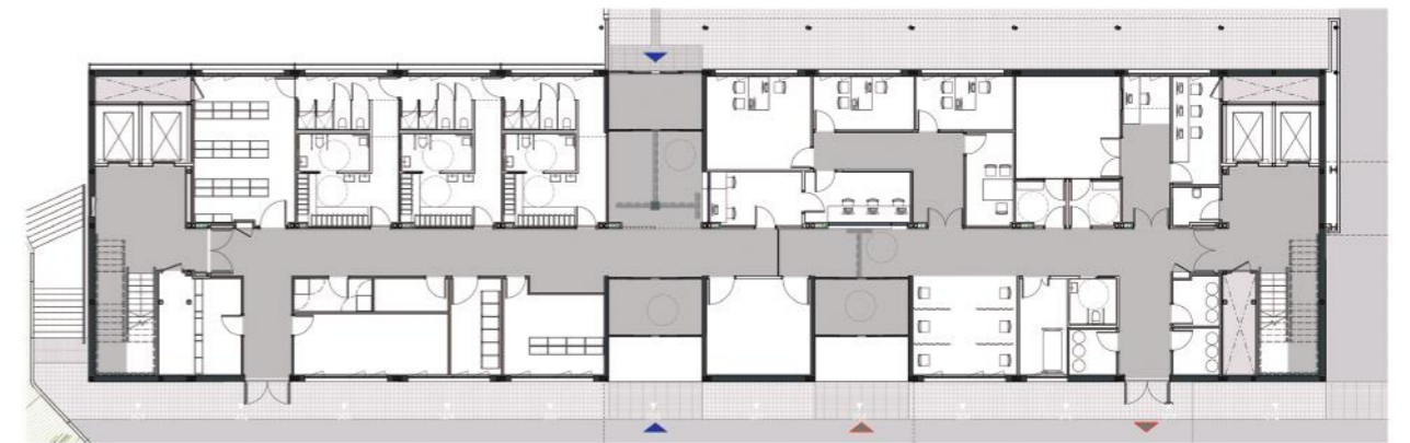
Plano: Planta Baja

Sistema Paciente - enfermería: Getronic Gases medicinales: Linde Cabeceros: UNEX