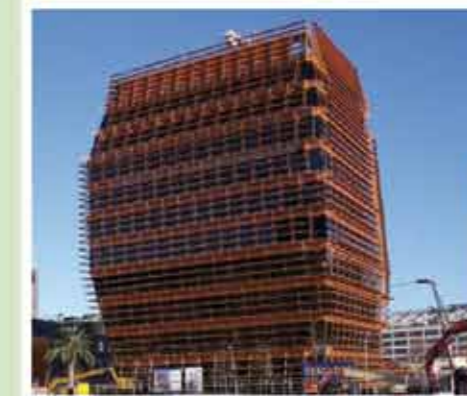
Edificio CMT @22 Barcelona

MAGDAN , les ofrece un servicio integral en cubiertas ajardinadas, basado en sus 40 años de experiencia y la colaboración con la empresa noruega Platon, inventora de las láminas drenantes retenedoras de agua con 1.200.000 m2 instalados.