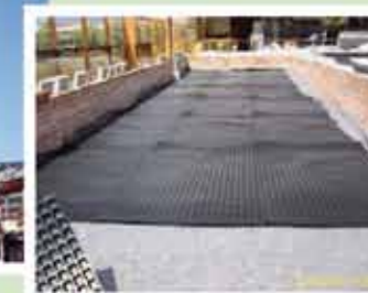
Realización: Jardinería Monés