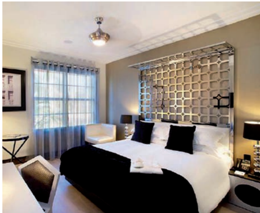
Foto: Habitación Hotel Waldorf Towers, Miami

mucha popularidad y que además son más fáciles de conocer, por ejemplo, un hotel... la gente de la ciudad no suele ir, solo los turistas o gente que viene por trabajo y sin embargo las salas de fiesta y los restaurantes son los que marcan la carencia de la ciudad.