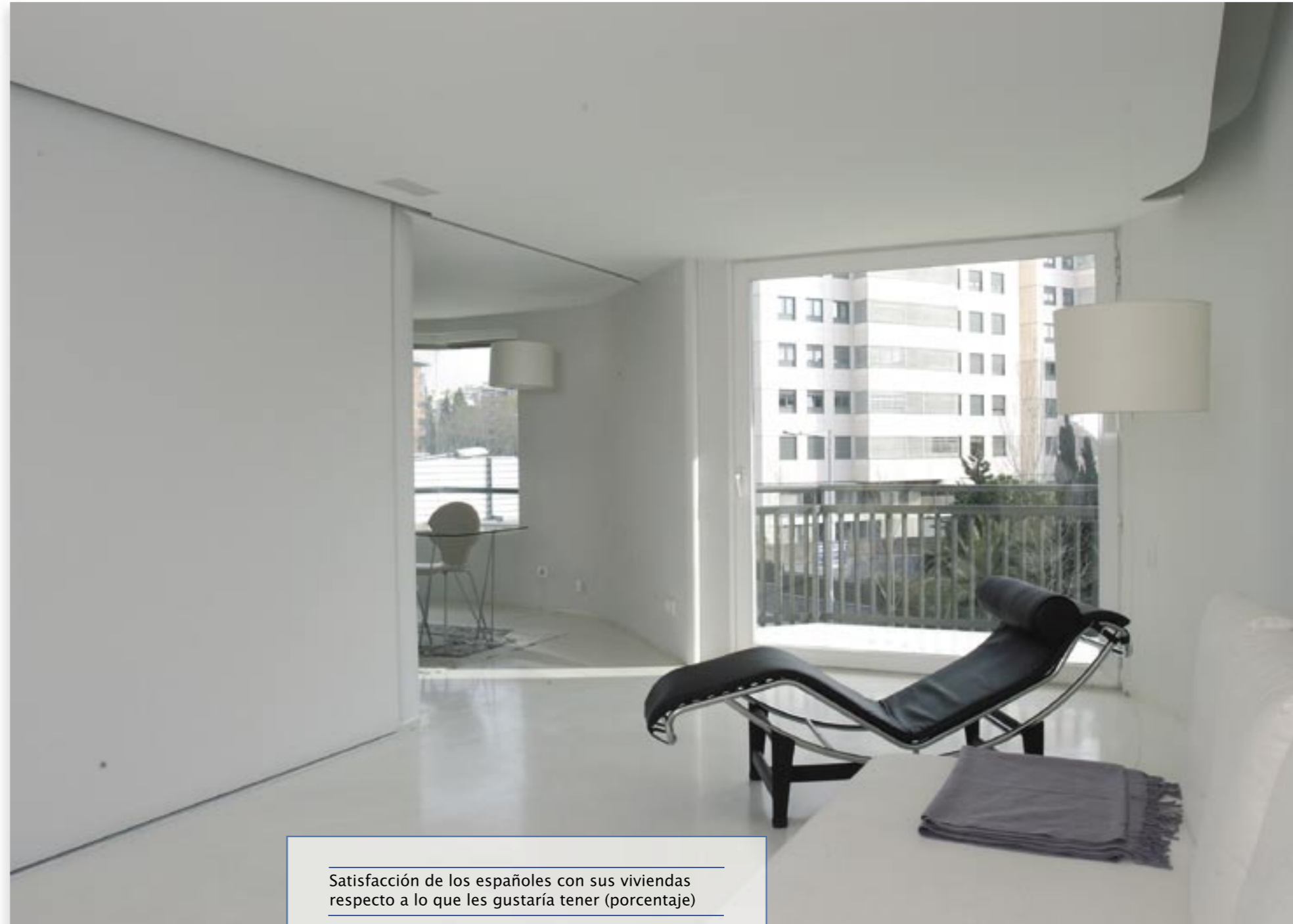
Satisfacción de los españoles con sus viviendas respecto a lo que les gustaría tener (porcentaje)

Según el estudio, el uso de materiales ligeros para la reforma de su hogar, como lo es la Placa de Yeso Laminado, es el preferido por el 38% de los españoles, antes que materiales tradicionales como el ladrillo o el yeso. Esta valoración en porcentaje ha aumentado en más de 10 puntos con relación a los datos del año 2004. En la capital española, un 38,6% de los encuestados señala que elegiría materiales ligeros (PYL) para reformar su vivienda, lo que supone un incremento del 13,3% con respecto al I Informe de la Vivienda de BPB Iberplaco del 2004.