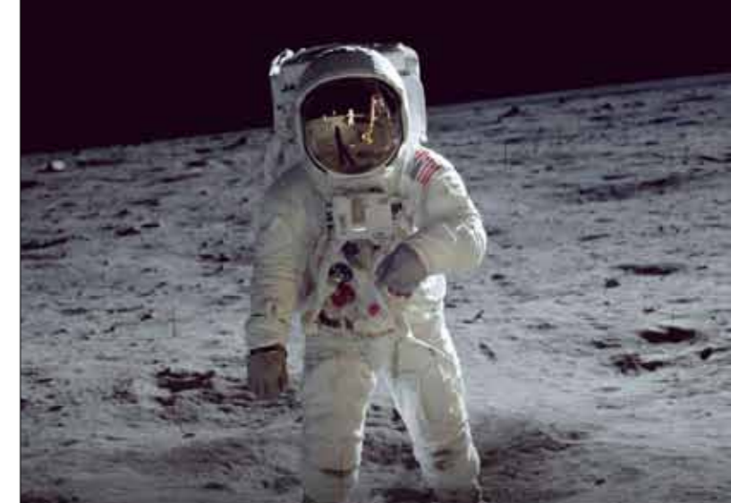
20 de julio de 1969, Neil Armstrong. Primer hombre que pisa la Luna

En esta línea, desde Anape se incide también en la necesidad de realizar labores de información y formación, como las que desarrolla la propia Asociación. Desde el punto de vista empresarial, la entidad desarrolla labores de representación del sector en mesas de negociación laboral, así como en la realización de estudios sobre impactos legislativos y actividades técnicas que optimicen la inversión de los recursos.